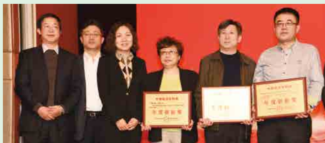
中国残疾人联合会荣获 “2015年中国政府采购制度创新奖”